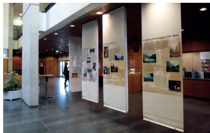
L'exposition ACVS au Mans (F), 2009.

En dix thématiques richement illustrées, l'exposition montre la mise en place et l'évolution du mythe helvétique du XVI e au XX e siècle, ainsi que l'élaboration de ses principales représentations diffusées par les récits d'écrivains voyageurs comme Voltaire, Byron, Hugo, Lamartine ou bien encore Daudet.