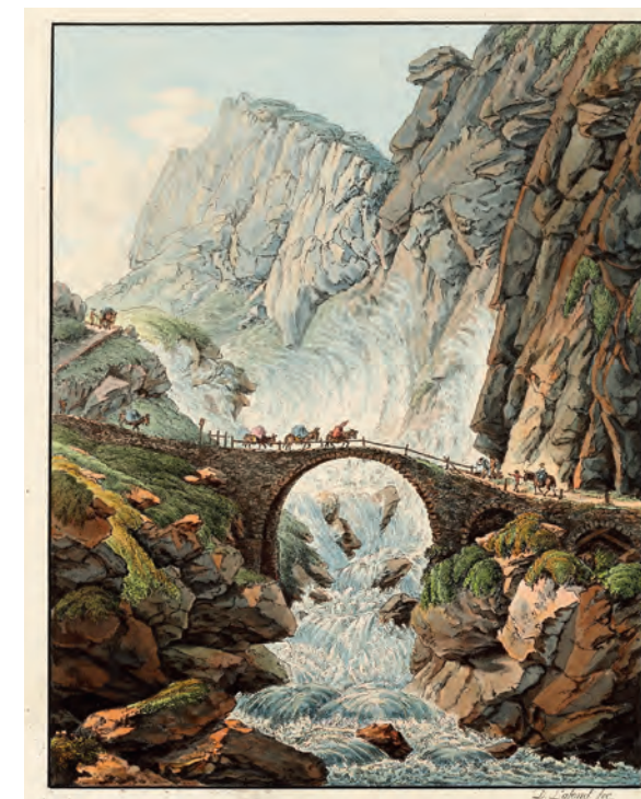
« Voyageurs traversant à dos de mules le fameux Pont du Diable sur la route du St-Gotthard (du côté d'Uri) ». In Recueil de paysages suisses dessinés d'après nature, dans une course par la vallée d'Ober-hasly et les cantons de Schweitz et d'Oury .

En rendant accessible ce corpus grâce à ses multiples possibilités de recherche, la base VIATIMAGES intéresse non seulement les historiens du voyage et du paysage, les historiens de l'art et de la littérature, les géographes, mais tout autant le grand public qui se passionne à la découverte de ces images.