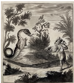
« Dragon effrayant un paysan sur le Wellerschen Gang, un sentier de montagne ». J.J. Scheuchzer, 1723.

Si celle des villes est parcourue depuis longtemps, c'est autour des montagnes que naît l'histoire du tourisme en