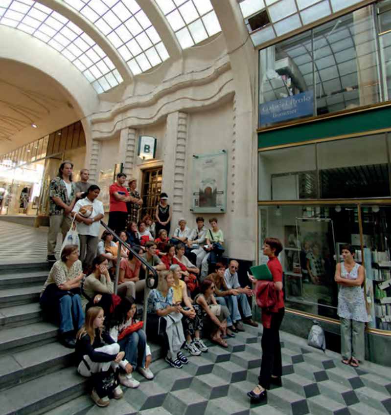
Visite guidée, galerie St François, Lausanne.